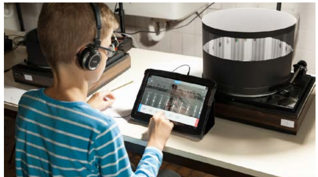
Deutsche Figurentheaterkonferenz 2019 Northeim

Bundespreisträger „Jugend creativ“ 2017